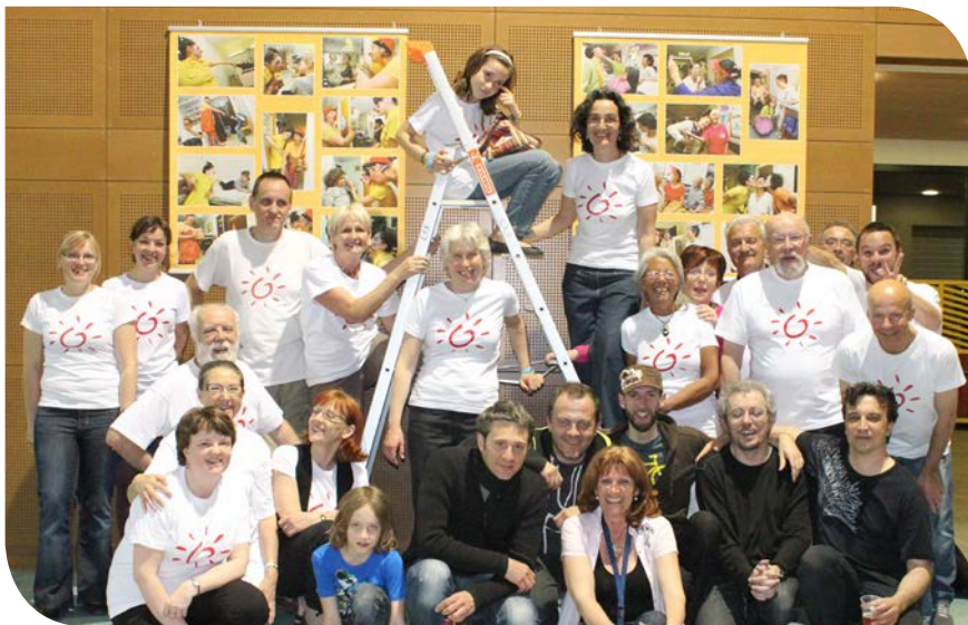
L'équipe des musiciens de DJAL et des bénévoles de Soleil Rouge

Après le succès remporté en décembre 2010, nous avons décidé de ne pas changer une équipe qui gagne et c'est avec beaucoup de joie que nous avons réinvesti la spacieuse Salle Robert Fiat de Saint Egrève pour un second Concert Bal Folk donné par DJAL. Ce samedi 31 mars, les 6 musiciens ont fait tourbillonner les danseurs jusqu'au bout de la nuit. Merci au fidèle soutien de ces artistes qui se sont donnés sans limite, à la Mairie et aux commerçants de St Egrève, aux nombreux bénévoles présents avant, pendant et après la manifestation.